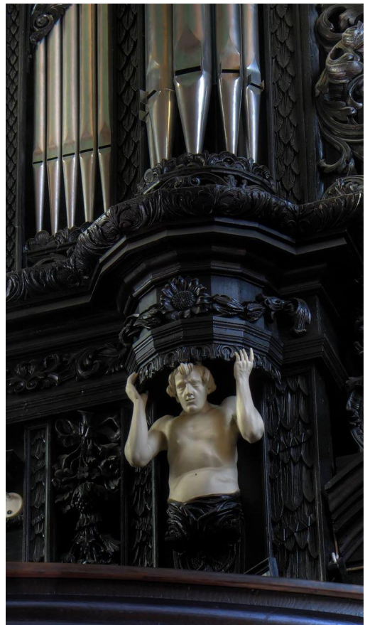
■ il.3. Prospekt organów Konkatedry Narodzenia Najświętszej Marii Panny w Żywcu - detal: atlant podtrzymujący jedną z wież piszczalkowych.

Już całkiem na marginesie rozważania o Aniołach, ale wciąż w kontekście przywołanego powyżej prospektu żywieckiego, zwróćmy jeszcze uwagę na inne postacie, które odnajdziemy w jego dekoracji. Chodzi o dwa atlanty dźwigające boczne wieże sekcji głównej organów. Atlant to postać muskularnego mężczyzny podtrzymującego na głowie, rękach bądź barkach jakiś element architektury, np. balkon, wykusz, belkowanie czy, tak jak tutaj, wieżę piszczalkową. Skoro jest to przedstawienie mężczyzny to naturalnie kusi nas aby ocenić czy jest to postać naturalnych rozmiarów czy też nie. Wydaje się, że niczym nie ryzykujemy. Ale kto wie czy zaraz ktoś, kto być może “uczepi się” pochodzenia nazwy tego detalu architektonicznego, nie zarzuci nam również i tutaj swego rodzaju nadinterpretacji. Bo atlant to z jednej strony element architektoniczny, ale z drugiej - Atlant/Atlas to postać mitologiczna - gigant nieznanych nam przecież rozmiarów... czyżby ten sam dylemat co w kwestii Aniołów?... a może to już przesadna ostrożność? Na koniec tej dygresji o atlantach zwróćmy jeszcze uwagę na rękę jednego z nich (tego na zdjęciu po lewej).