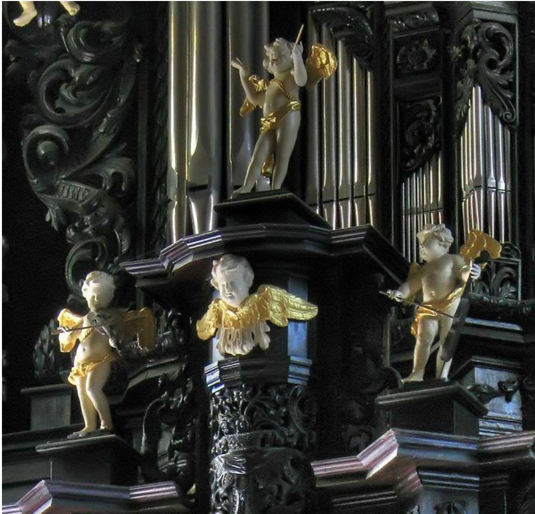
■ il.2. Organy Konkatedry Narodzenia Najświętszej Marii Panny w Żywcu - detal: orkiestra anielska w zwieńczeniu Rückpositivu.

Oprócz Aniołów na prospektach odnajdujemy często również przedstawienia św. Cecylii oraz króla Dawida. Idąc głównym tropem tego tekstu trzeba przyznać, że akurat w przypadku tych postaci nie mamy problemu opisanego powyżej, bo relację między wielkością posągu czy malowidła a wielkością przedstawionej postaci jesteśmy w stanie uchwycić. Wszak byli to ludzie. I oczywiście można się spierać czy osoby te były niskie czy wysokie, szczupłe czy raczej krępe, itd., ale skoro byli to ludzie, to można zaryzykować ocenę np. wielkości posągu jako naturalnych bądź ponadnaturalnych rozmiarów (lub też można mówić o miniaturze). W przypadku Aniołów, jak już wiemy, taki zabieg jest bardzo ryzykowny, bo dla śmiertelników nieweryfikowalny.