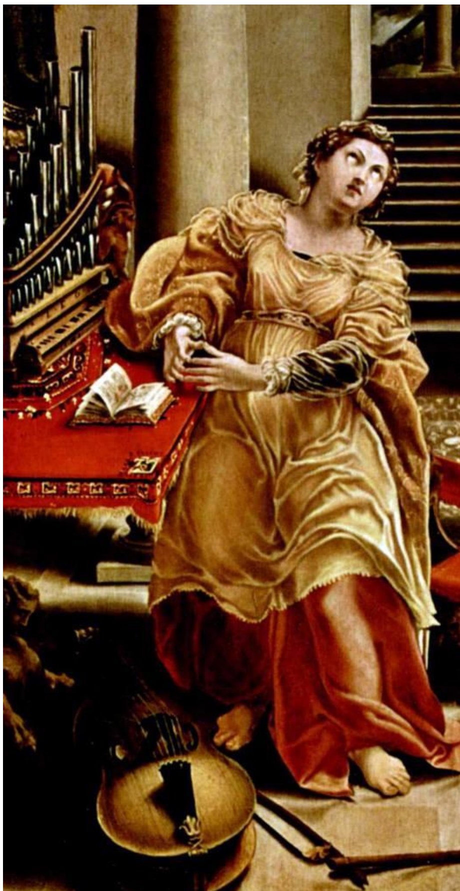
■ il.4. "Św. Cecylia", Lelio Orsi.