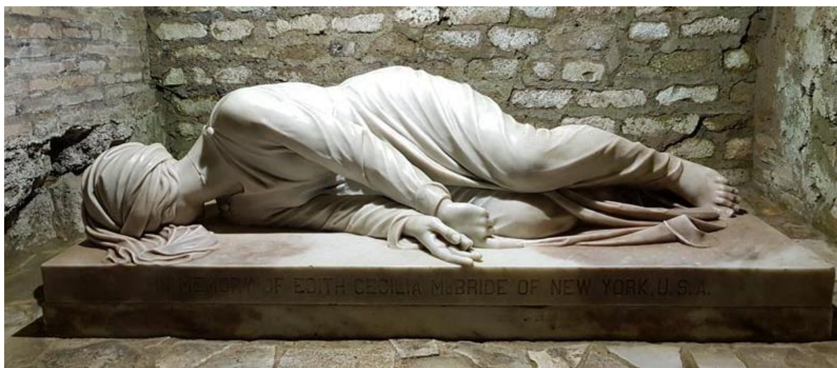
■ il.1. Krypta św. Cecylii, kopia rzeźby Stefana Maderna (Katakumby św. Kaliksta w Rzymie).

Sarkofag z ciałem św. Cecylii znajduje się obecnie w poświęconej jej bazylice na rzymskim Zatybrzu. Wcześniej, do roku 821 ciało świętej złożone było w katakumbach św. Kaliksta, skąd przeniesiono je na polecenie papieża św. Paschalisa. W bazylice św. Cecylii na Zatybrzu (Rzym) znajduje się rzeźba autorstwa Stefano Maderno (kopia tej rzeźby znajduje się również w krypcie św. Cecylii w katakumbach św. Kaliksta), która przedstawia nienaruszone ciało św. Cecylii w pozycji, w jakiej odnaleziono ją w sarkofagu w 1599 roku gdy identyfikowano relikwie. Rzeźbiarz wyraźnie zaznaczył ranę od miecza na szyi Cecylii, uwagę zwraca również ułożenie palców – "... trzy wyprostowane u prawej ręki i jeden wyprostowany u lewej. Według tradycji, święta chciała wskazać na swoją wiarę w Boga Jednego i w Trójcy Jedynego" (cyt. za: https://www.catacombe.roma.it/pl/crypta-santa-cecilia.php ).