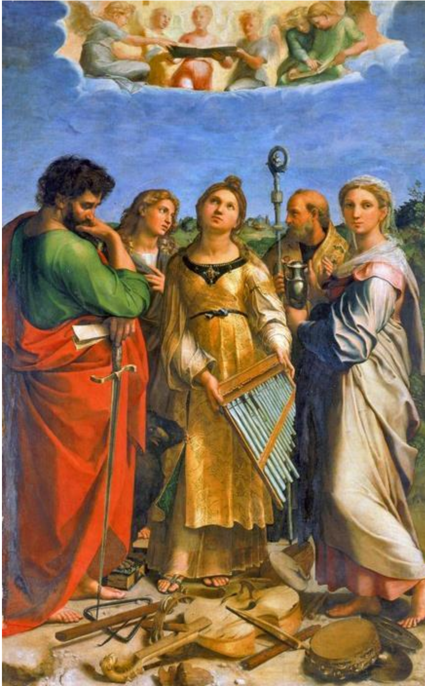
■ il.2. "Ekstaza św. Cecylii", Raphael.